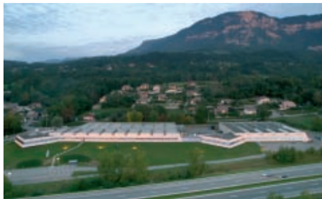
*Homologation européenne Directive 2002/24/CE

La fabrication des principaux éléments, l'assemblage final et les contrôles de qualité de nos véhicules* sont assurés par un personnel qualifié. Sur près de 8 hectares, plus de 14 000 véhicules en moyenne sont produits chaque année pour être expédiés en France, en Europe et en Amérique du Nord.