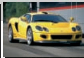
MEGA Monte Carlo