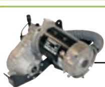
Électrique écologique et silencieux